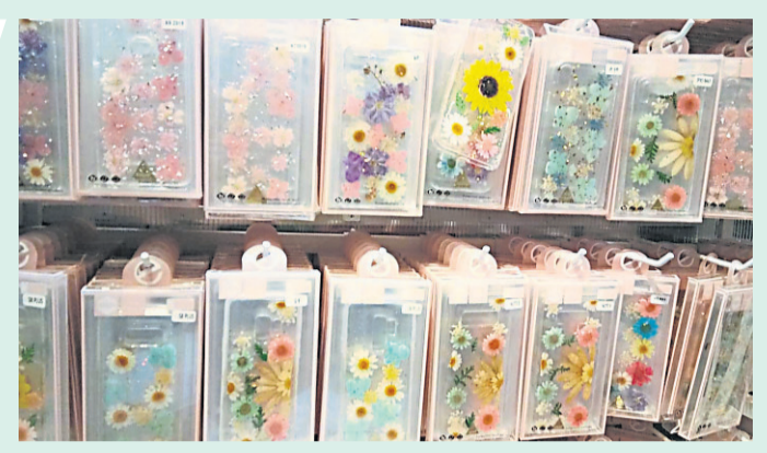
这款手机壳背后有真花的设计主要针对上班族女性。