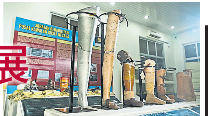
博物馆内陈列的义肢和里面展示物品的都是院民生活的重要文献和集体记忆。

“政府计划开设6间展馆,目前已完成的4间展馆包括文物馆、资料馆和重要文献馆和实验馆。这些展馆完整地保留院民过去的的生活轨迹和社区史。实际上这里就是一座活的文化遗产,访客可以进来跟院民买花,可以跟他们聊天,访问他们,了解他们的过去。”