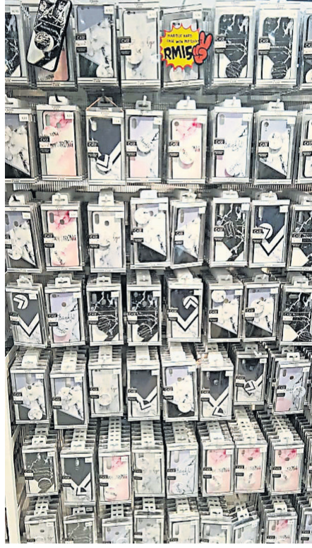
以大理石为设计的手机壳,也是顾客的选择之一。

他说,当生意开始起飞时,疑招人眼红,竟被要求关档;他意识到危机,知道要让自己变得强大、品牌知名度高,才能有立足之地。于是,他于2013年将其零售业转成批发市场,而其品牌也在努力耕耘下逐渐打响名声,在巨盟批发城的店面更是一间接一间地开。