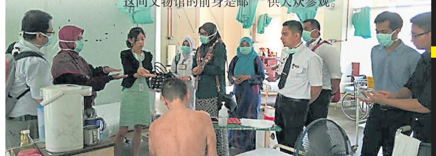
病楼里的临床教学,让医生有机会从麻疯杆菌留在院民身上的永久记印中认识麻疯病。

为了让社会各阶层人士更了解希望之谷丰富的历史背景,艺术馆、故事馆、文物馆、资料馆和实验馆也会在11月2日当天对外开放,供大众参观。