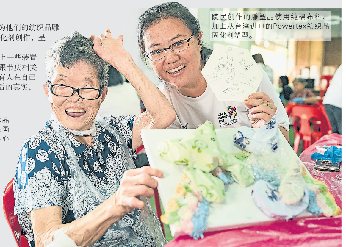
院民创作的雕塑品使用纯棉布料，加上从台湾进口的Powertex纺织品固化剂塑型。