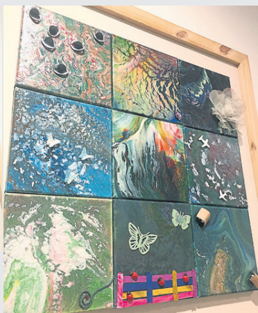
浇画作品有院民画家的心思。